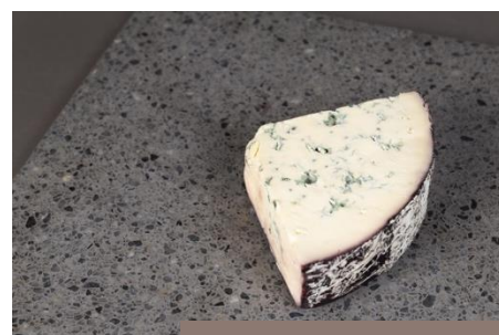
BluDivino Caseificio Pier Luigi Rosso

Un bleu pas comme les autres, affiné au vin rouge au Barbera d'Asti. Résultats : un fromage aux arômes profonds et une texture fondante presque gourmande. À mi-chemin entre fromage et dessert, il surprend par son intensité et sa finesse. Une expérience à part, pensée pour les amateurs de découvertes.