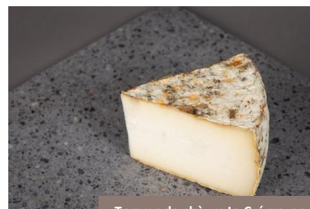
Tomme de chèvre La Crémeuse Prolactine Cave Rousseau

Une tomme tout en douceur, loin des idées reçues. Son affinage en cave naturelle lui confère une flore singulière et des arômes fins légèrement fruités. Un fromage apprécié de tous, aussi bien seul que sur une belle tranche de pain ou avec quelques fruits.