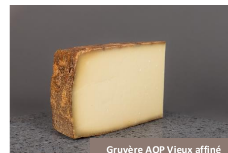
Gruyère AOP Vieux affiné aux Forts de la Tine Huguenin Fromages

Affiné entre 18 et 22 mois, ce Gruyère AOP révèle toute la richesse du lait cru. Sa texture ferme et ses arômes puissants en font un fromage de caractère et particulièrement addictif. Un grand classique porté à son plus haut niveau.