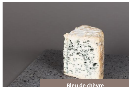
Bleu de chèvre Société Laitière de Laqueuille

Un bleu qui bouscule les codes des pâtes persillées ! Elaboré à partir de lait de chèvre, il mêle douceur et caractère dans un équilibre surprenant. A la fois crémeux et légèrement intense, il offre une alternative originale aux bleus plus classiques. Idéal pour varier les plaisirs, il se marie très bien avec un peu de miel ou des fruits secs.