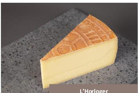
L'Horloger Fromages Spielhofer

Un fromage inspiré de l'horlogerie suisse, où tout est une question de temps et de précision. Sa pâte pressée révèle un goût subtil et équilibré. Son visuel, inspiré d'un cadran de montre, en fait un produit à part, aussi beau à regarder qu'agréable à partager sur un plateau de fromages. Son plus ? On peut le découper minute par minute selon le grammage.