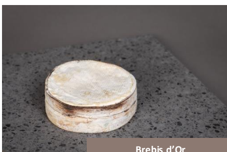
Brebis d'Or Fromagerie Moléson

La Fromagerie Moléson est une nouvelle fois sur le podium avec ce fromage de brebis à pâte molle. Enveloppé d'une sangle d'épicéa, il développe de délicates notes boisées qui viennent sublimer la douceur du lait. Il révèle aussi tout son potentiel chaud, simplement passé au four et dégusté avec quelques pommes de terre. Un fromage réconfortant, parfait pour toutes les saisons.