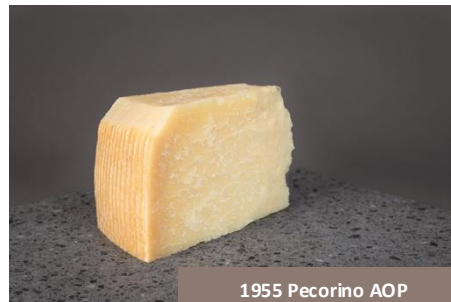
1955 Pecorino AOP Busti Formaggi

C'est toute la puissante italienne ! Affiné longuement, ce Pecorino AOP dévoile une richesse et une profondeur qui se découvrent au fil de la dégustation. Doux au départ puis plus intense, il développe des notes de beurre et de fruits secs qui restent en bouche. Un fromage de caractère pour les amateurs de belles découvertes.