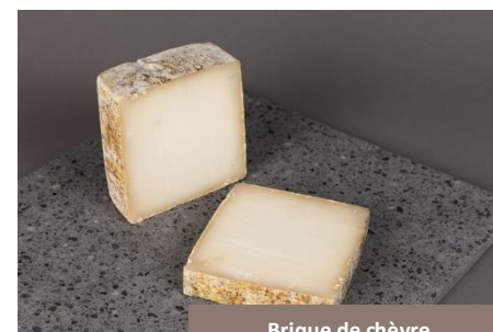
Brique de chèvre Prolactine Cave Rousseau

Avec son format original et sa pâte onctueuse, cette tomme revisite les classiques. Affinée artisanalement à Chambéry, elle développe des saveurs douces et légèrement sucrées en fin de dégustation.