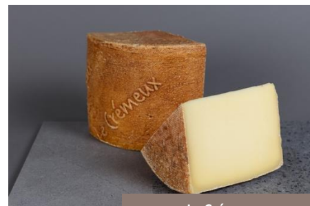
Le Crémeux Fromagerie Moléson

Tout est dans son nom ! Un fromage qui respire la gourmandise... Enrichi en crème et affiné plusieurs mois, il offre une texture souple et une belle longueur en bouche. Un produit généreux, au goût affirmé, qui sort des codes classiques des pâtes pressées.