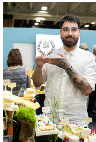
Lyre d'Or 2026

Les candidats ont découvert sur place de 3 fromages imposés avec pour mission : la réalisation de découpes inédites, la mise en valeur sur un plateau, l'identification des produits.